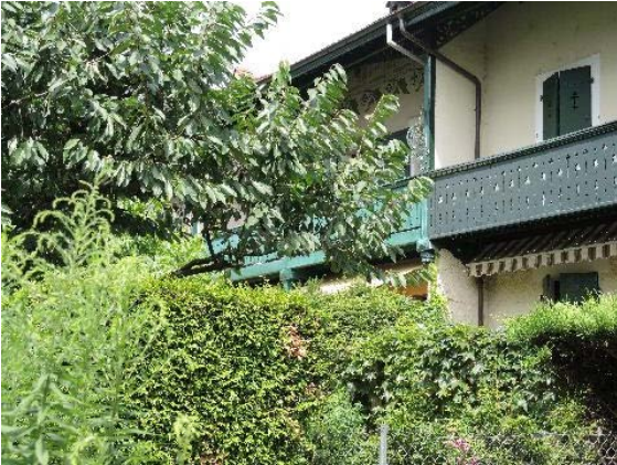
De-Maisonnette 27 et Anémones 4, façades sud-ouest, détail