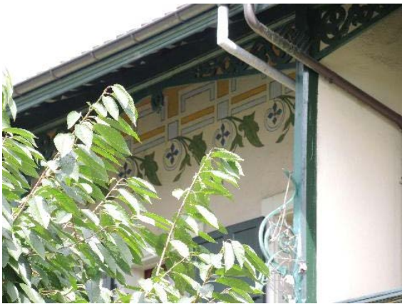
Façade sud-ouest, détail frise peinte