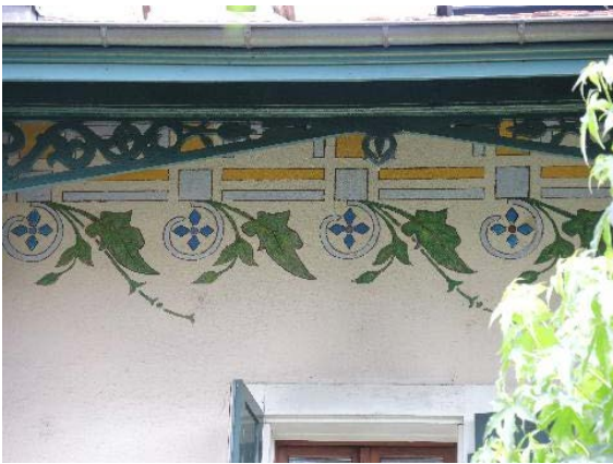
Façade sud-ouest, détail frise peinte