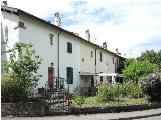
De-Maisonneuve 25-Anémones 4-De-Maisonneuve 27-Anémones 8, façades nord-est, depuis chemin De-Maisonneuve