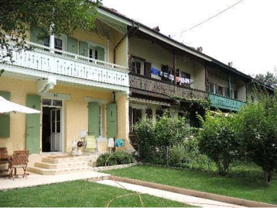
Anémones 10-8-De-Maisonnette 27-Anémones 4, façades sud-ouest