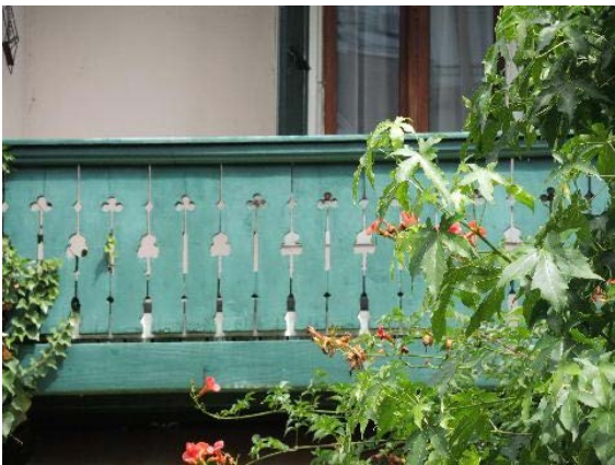
Façade sud-ouest, détail balcon