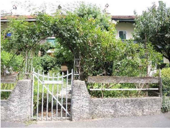
Portail d'entrée et jardin (sud-ouest)