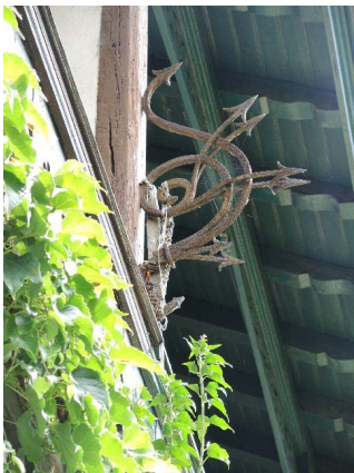
Anémones 8-De-Maisonneuve 27, façade sud-ouest, détail ferronnerie