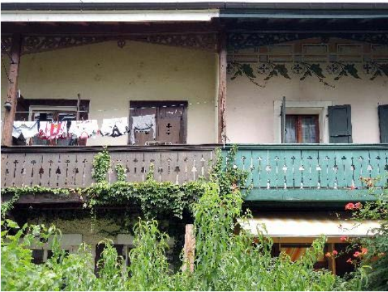
Anémones 8 et De-Maisonnette 27, façades sud-ouest