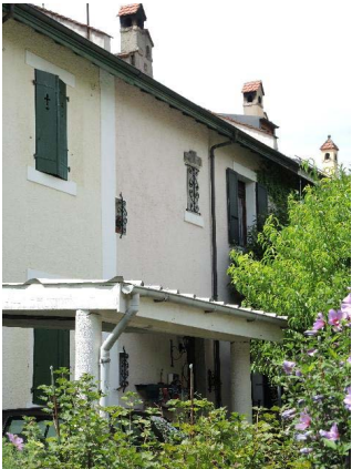
De-Maisonneuve 27, façade nord-est (centre)