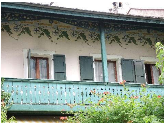
Façade sud-ouest, détail frise peinte et balcon