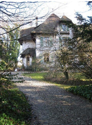
Entrée et Villa