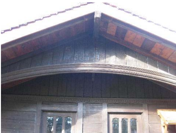
Châlet - pavillon de jardin, nord-ouest + inscription