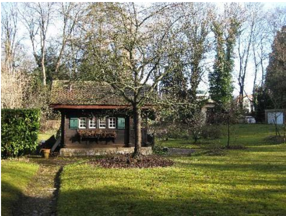
Châlet - pavillon de jardin, nord-ouest