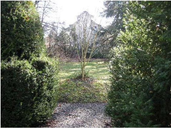
Jardin vue sur Jules-Cougard 15 (sud-est)