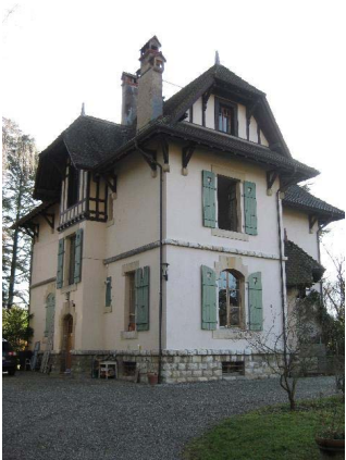
Angle façades nord-est et nord-ouest