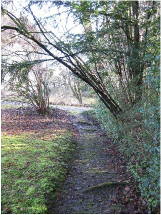
Jardin (ouest direction sud)