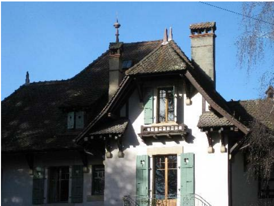
Façade sud-est, pignon