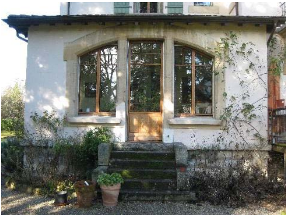
Façade sud-est, jardin d'hiver