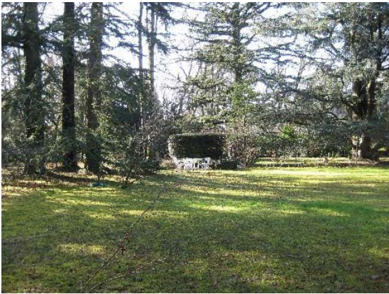
Jardin (sud - sud-est)