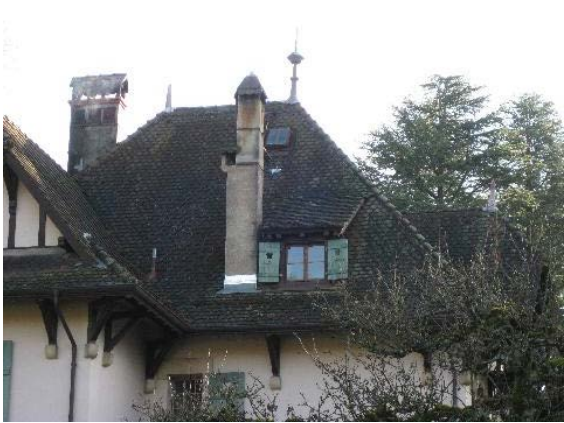
Détail toiture (façade nord-ouest)