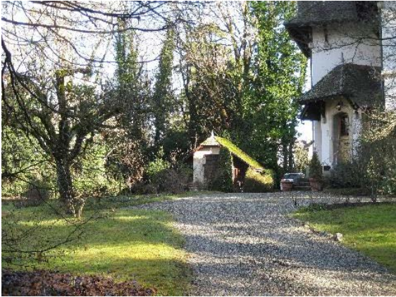
Jardin et annexe nord