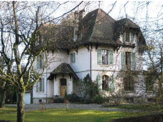
Entrée principale entre les façades nord-ouest et sud-ouest