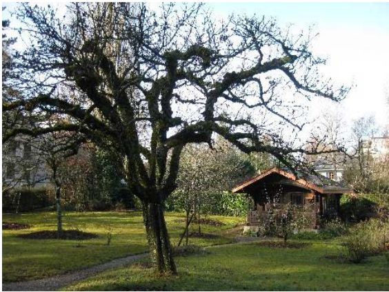
Châlet - pavillon de jardin, nord-ouest