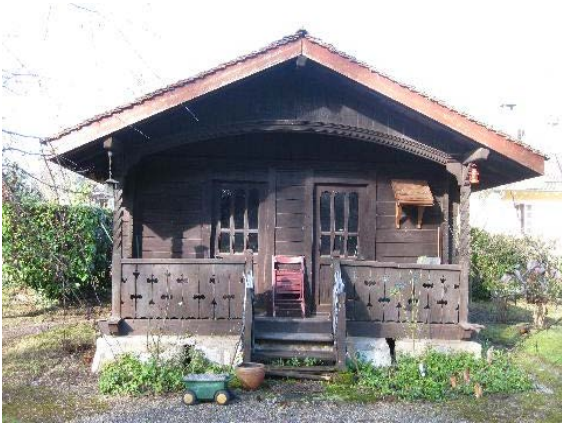
Châlet - pavillon de jardin, nord-ouest