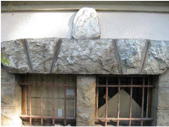
Façade sud-ouest, détail pierre ouvragée femme et cupidon