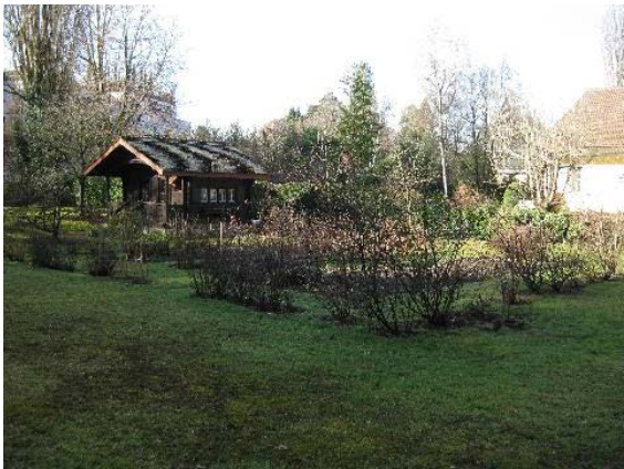
Châlet - pavillon de jardin, nord-ouest