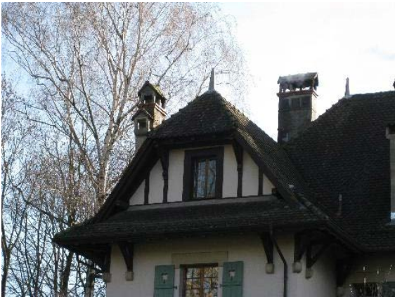
Pignon façade nord-ouest